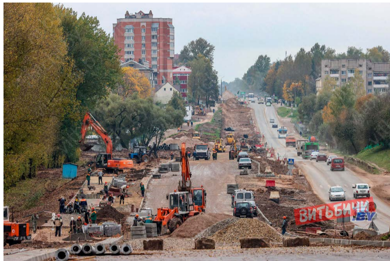
Материалы полосы подготовила Татьяна САВИЧ

В Витебске реализуется один из масштабных и долгожданных инфраструктурных проектов — реконструкция ул. Гагарина. Последний раз большая стройка тут была в 1952 году, когда прокладывали трамвайную ветку. Затем проводился лишь незначительный ямочный ремонт. Словом, сегодня больше чем за полвека улица приобретает новый вид. На знаковой стройплощадке региона в ежедневном режиме работают строительные организации Витебщины. Генеральный подрядчик — ОАО «Строительный трест № 9», на субподряде — ОАО «Мехколлон № 43, г. Витебск», ОАО «ДСУ-45, г. Витебск», ОАО «Тираспольская ПМК» и другие. Проектировщик — УП «Институт Витебскгражданпроект».